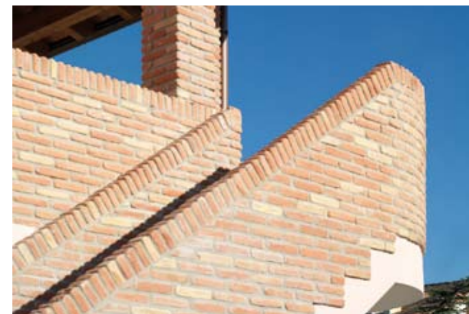
Complesso residenziale Lido Estensi, Ferrara BORGO VECCHIO MISTO COLORE

Il Borgo Vecchio Misto colore consente di unire la peculiare irregolarità delle forme di questa tipologia di mattone, con la varietà delle colorazioni. Il Borgo Vecchio Misto Colore si compone infatti di elementi dal colore rosato, rosso e paglierino. La resa estetica è particolare ed originale, unica nel panorama del mattone Faccia a Vista in Pasta Molle.