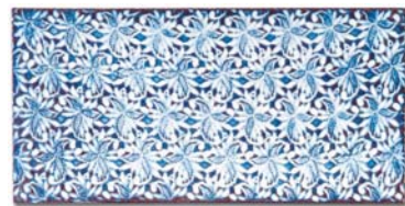
macramè - 50x25 cm