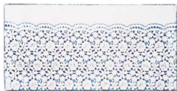
tarabesque - 50x25 cm