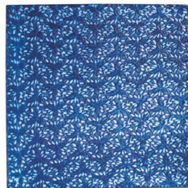
macramè - 50x50 cm