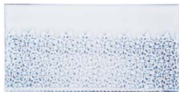
taras - 50x25 cm